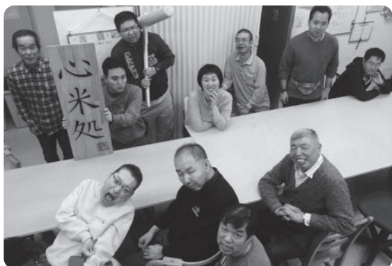
元気いっぱい“こころや”のメンバー

ライフでは、色々な職種の事業を展開しています。一度働いてみて自分に合わないな—と思ったら、ライフの中で別の職種を探すことも出来ます。お気軽に、自分にピッタリのお仕事探しをしませんか？