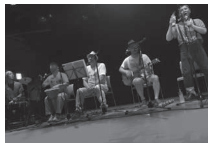
▲THE人生ズのステージの様子

7月1日琴似パトスにおいて、スクリュー高井・THE人生ズ・ジャナグルのコンサートがありました。しかしなぜか、F氏がステージ前でおどりまくり、ほとんど見えなかったです…汗