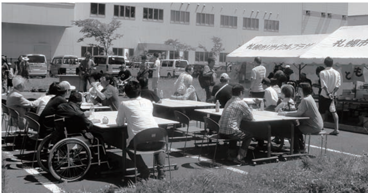
カンウェイC4バンドの演奏を楽しみながら、ともども屋台で寛ぐようす

9月には「秋のともどもまつり/まつりだ環っ」が開催されます。次はどんな出会いが待っているかな? 今からワクワクしています!