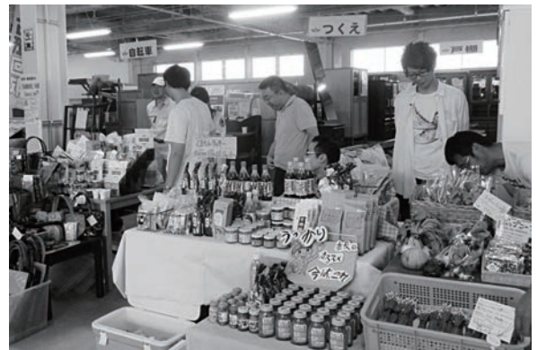
たねや・きばりや商品準備OK～お客さんいらっしゃい～!!